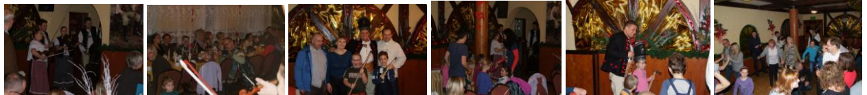
Fot. Zbójcka zabawa andrzejkowa z Karpackimi Zbójami.

Dzień ten przypada na końcu lub na początku roku liturgicznego. Andrzejki są specjalną okazją do zorganizowania ostatnich hucznych zabaw przed rozpoczynającym się adwentem. W Szkocji, jako święto bankowe, hucznie obchodzony jest dzień świętego Andrzeja, tj. 30 listopada, tam czci się go hucznie jedząc i pijąc.