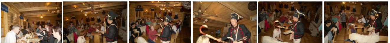
Fot. Zbójcka zabawa andrzejkowa z Karpackimi Zbójami.

Kozdy z Wos jak prawdziwy zbójnik będzie musioł sie wykozać sprytem, inteligencjom, sprawnością fizycom i łodwagom. Tak zeby ze swoim łupem, plecokiem pełnym harnasiowych wrażeń, wrócił scośliwy ku chałupie i zeby słaWił gorolskom ślebode! Hej!