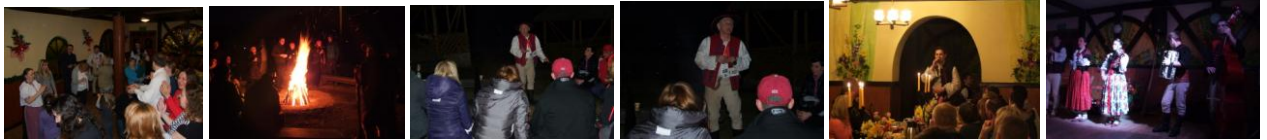
Fot. Zbójcka zabawa andrzejkowa z Karpackimi Zbójami.

Andrzejki (znane też jako Jędrzejki lub Jędrzejówki) – wieczór wróżb odprowadzanych w nocy z 29 na 30 listopada, w wigilię świętego Andrzeja, patrona Szkocji, Grecji i Rosji. Pierwsza polska wzmianka literacka o nim pojawiła się w 1557 za sprawą Marcina Bielskiego.