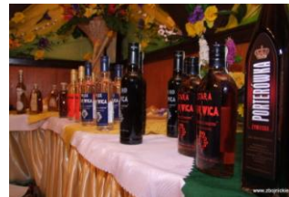
Fot. Degustacje alkoholi podczas zbójnickich Andrzejek.